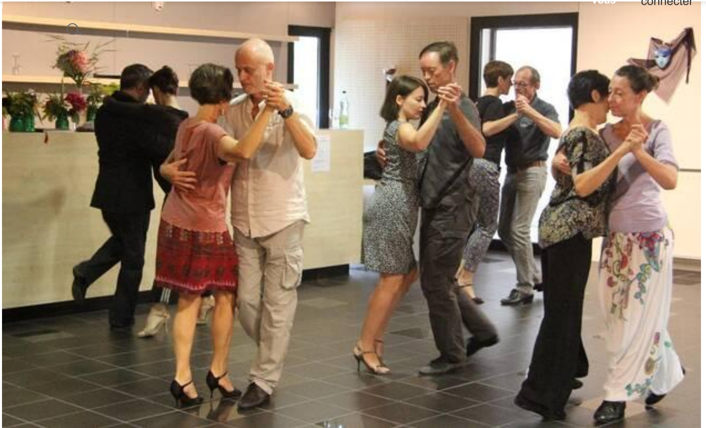
Il reste des places dans certains cours. Si certains veulent se lancer...